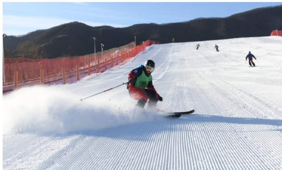
▲随着北京冬奥会的临近,冰雪旅游持续升温

春节的脚步近了,您那颗爱旅游的心是不是早就按捺不住啦?携程等旅游机构预测,在即将到来的猪年春节黄金周,我国将有约4亿人次出游。人们的旅行半径比往年扩大了,出境游将前往约90个国家和地区,以国内典型旅游城市为目的地的出行人数也增长明显。“避寒”和“冰雪”是两大出游主题词。