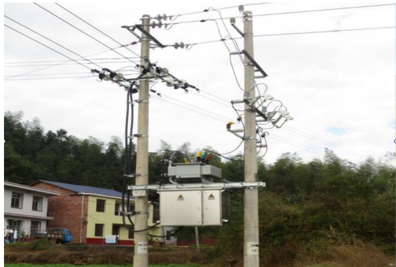
▲改造后变压器台区安装规范且美观

本报讯(记者刘玺 通讯员吴珊)2018年我市10项工作被纳入“省重点民生实事”,本报记者连日来走访相关承办单位,一起来看看他们的成绩单吧。本期报道关注行政村10千伏及以下配电网的改造和完善。