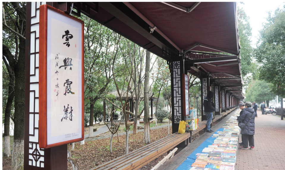
▲书画长廊

目前,我市的省“两型村庄”已达6个,另外两个为2016年入选的荷塘区仙庾村、樟霞村。