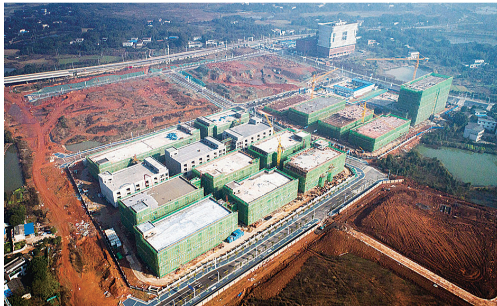
▲云龙创业创新园功能分区初显(资料图)