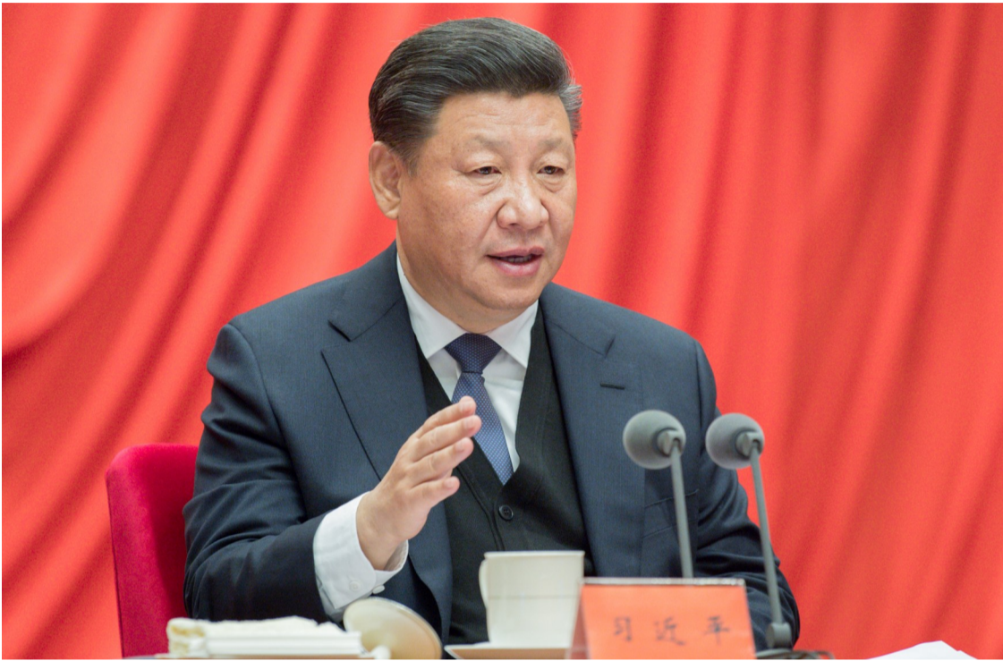
▲习近平出席十九届中央纪委三次全会并发表重要讲话