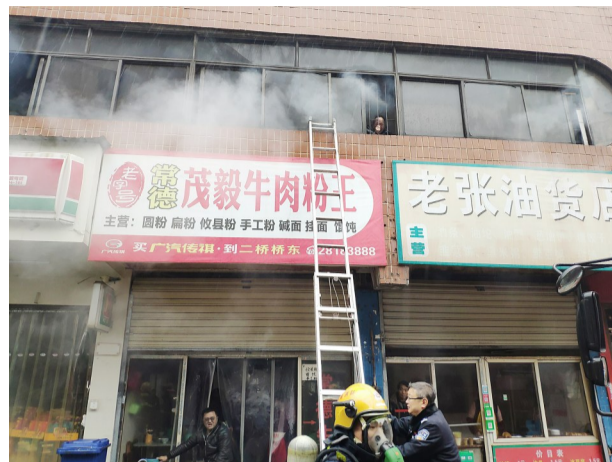
▲二楼多人被困,消防员正准备救援

参与救援的消防人员说,到达现场后,他们发现黑烟不断从窗户往外冒,房内似乎没人。随后,他们对防盗门进行破拆,确认屋里无人后,网格员通过网络中心信息平台查到了户主电话,并及时通知户主回家。