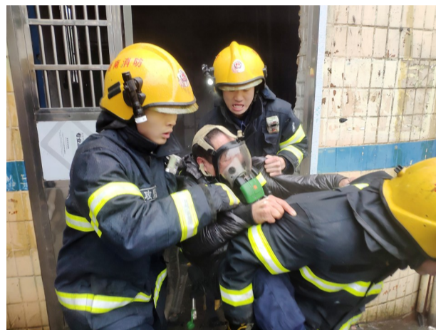
▲一名被困男子被消防员背出

“当时房子里火势较大,一个电烤火炉和一台悬挂在墙上的空调挂机已经被烧得面目全非,房内弥漫了一股刺鼻的气味。”消防人员介绍,他们很快将火扑灭。