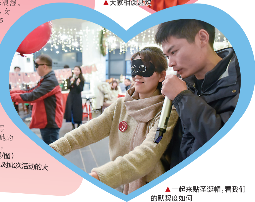
▲一起来贴圣诞帽,看我们的默契度如何