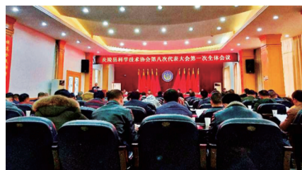
▲会议现场