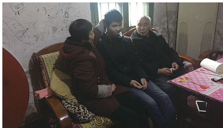
▲儿子12年未归,老两口对患有残疾的孙子的未来很担忧