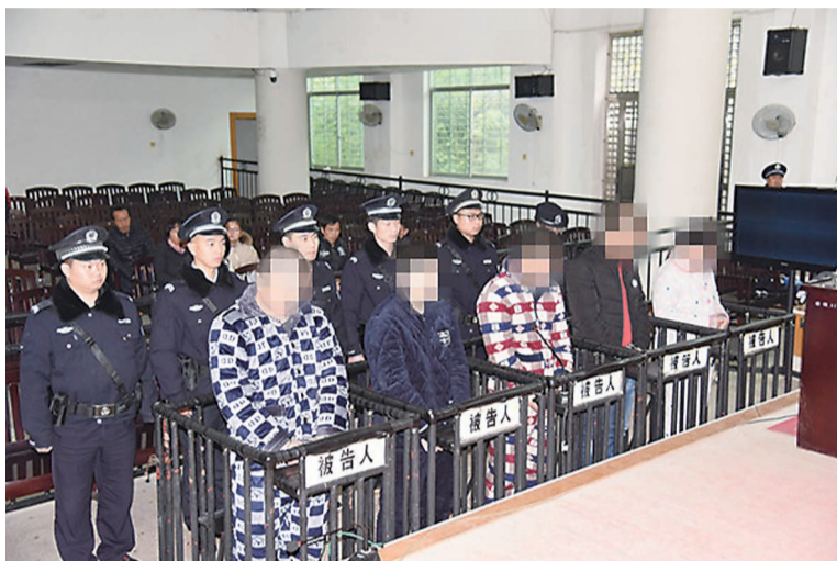
▲攸县法院公开宣判现场

本报讯(记者 贺天鸿 通讯员 徐世俊 康帅)12月20日,茶陵法院、攸县法院对涉黑涉恶犯罪案件进行了集中宣判,21名被告人获刑。