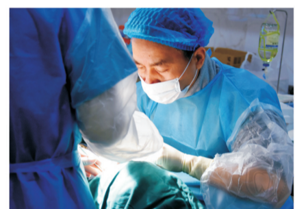
▲种植牙手术现场 博乐仕口腔

者与传统种植方案相比,这种治疗方案的治疗时间更短、成本更低。只需要植入4-6颗种植体即可恢复半/全口牙缺失,如果骨头条件好,还可以实现当天种牙当天用。”