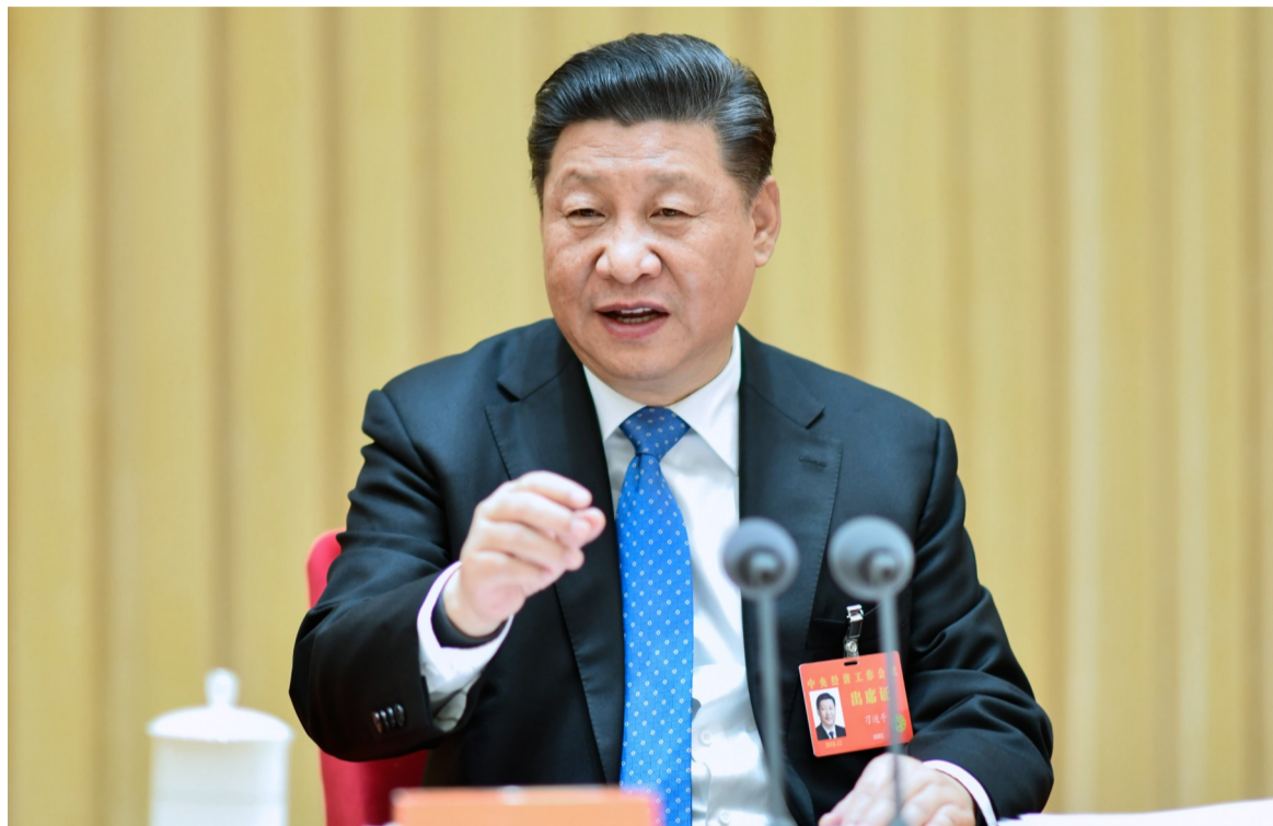
▲习近平在中央经济工作会议上发表重要讲话

习近平在会上发表重要讲话,总结2018年经济工作,分析当前经济形势,部署2019年经济工作。李克强在讲话中对明年经济工作作出具体部署,并作了总结讲话。