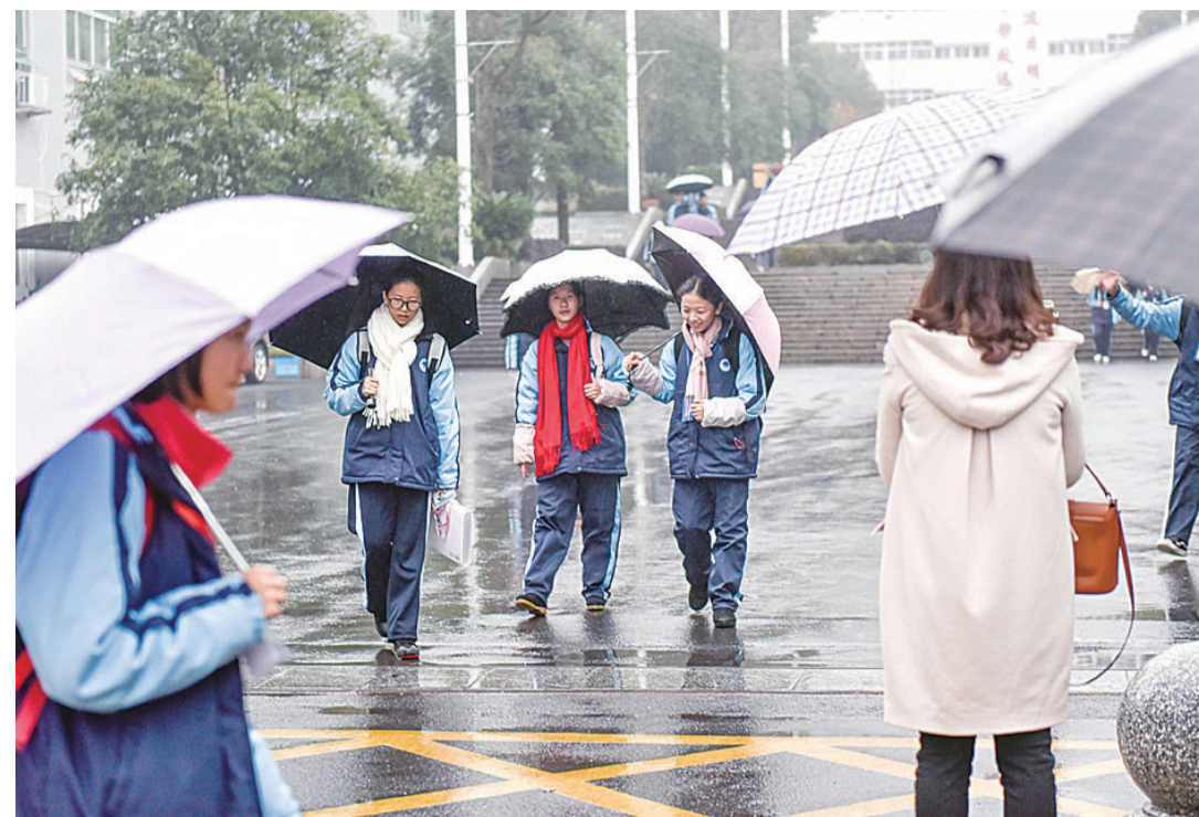
▲昨天,小雨淅淅沥沥下个不停。神农城广场,放学的学生们都撑起了雨伞