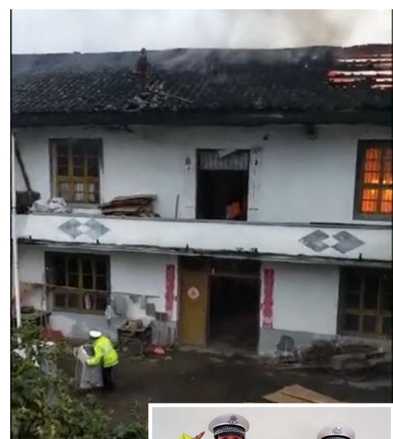
▲民房起火,辅警正在帮着搬出电器视频截图