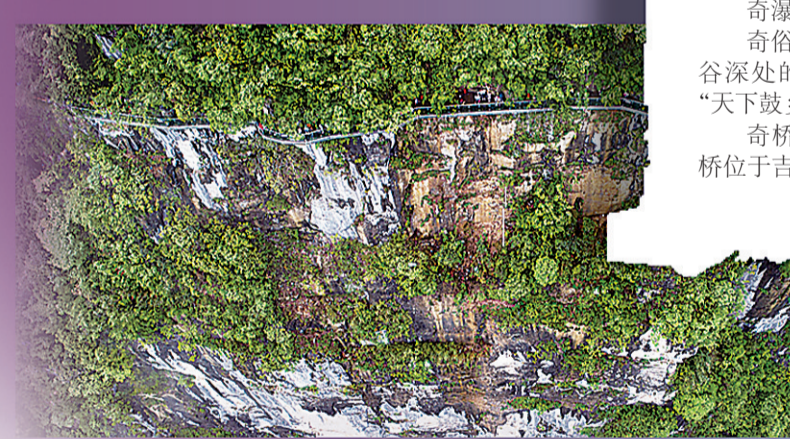
▲航拍矮寨栈道