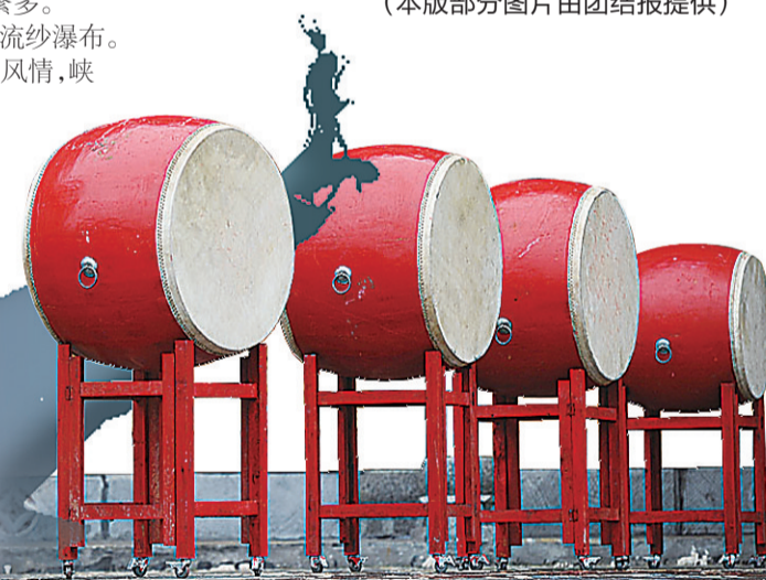
▲德夯苗寨,被誉为“天下鼓乡”