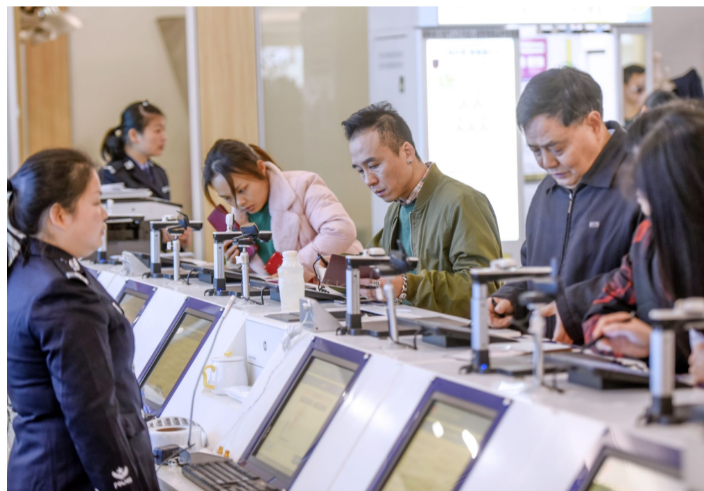
▲昨日,有市民提前到市民中心进行咨询、体验