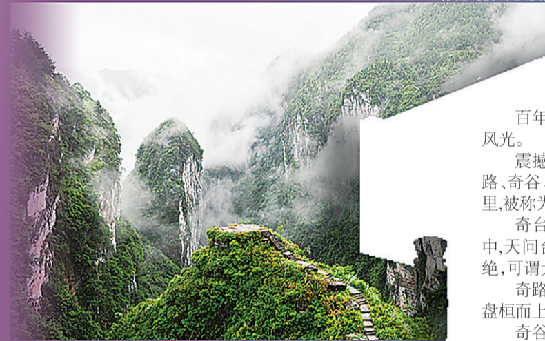
▲矮寨天问台