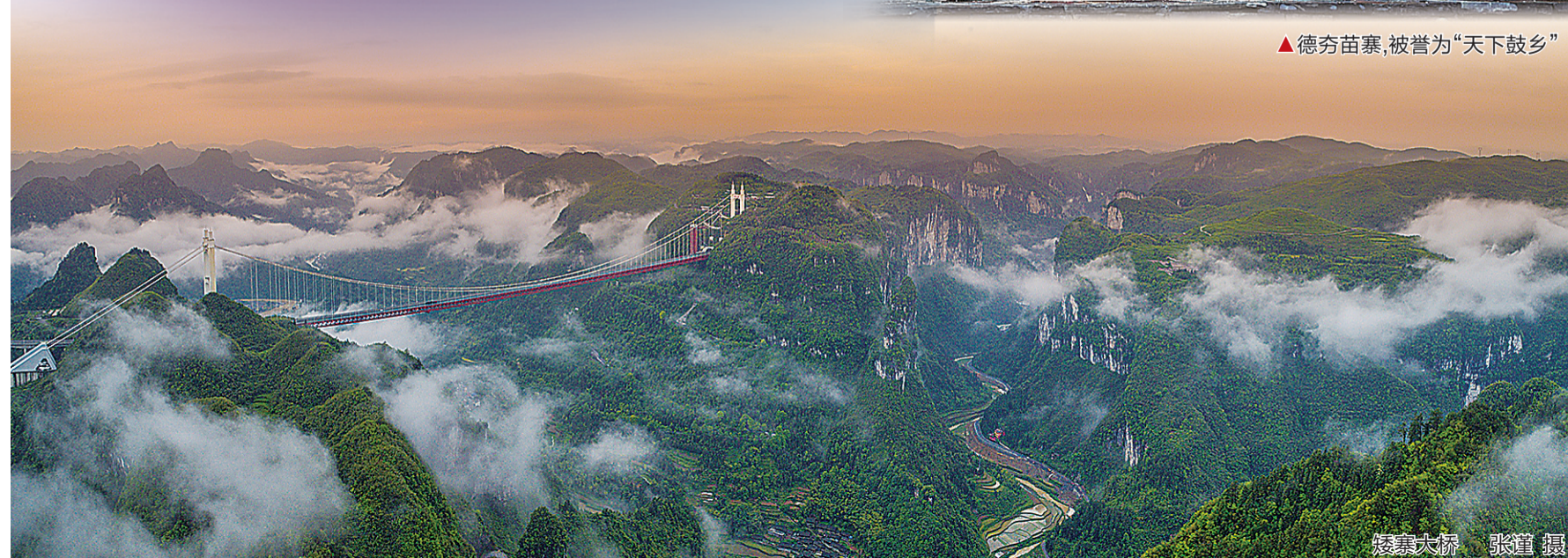
矮寨大桥