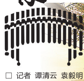
□ 记者 谭清云 袁毅明