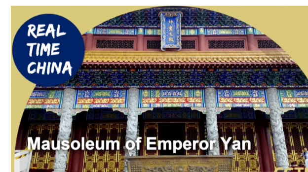
▲炎帝陵的直播节目宣传片 视频截图

据了解,中国国际电视台是中国中央电视台旗下国际传播机构,成立于2016年12月,拥有6个电视频道、3个海外分台、1个视频通讯社和新媒体集群,面向全球受众提供新闻传播服务。