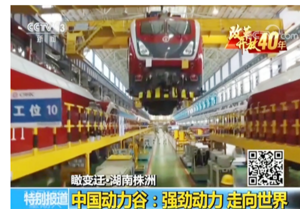
▲央视新闻频道报道中国动力谷 视频截图

本报讯(记者 戴凇)安静的磁浮列车、指甲盖大小的IGBT芯片,还有科技感十足的智轨列车……昨日,央视新闻频道(CCTV13)栏目“改革开放再出发”之“瞰变迁·湖南株洲”,重点报道了“中国动力谷”正以强劲的动力走向世界。