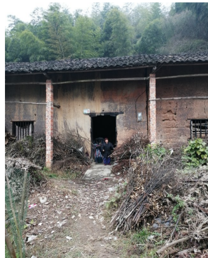
▲程媵家的土砖房年久失修，她盼着有人能常来陪说话

本报讯(记者 陈驰)74岁的程媵住在芦淞区白关镇芷钱桥村曹门组一山坡下。家中的木质大门已经腐烂，土砖房四处破损。老人坐在堂屋里，不时搓搓手、裹裹身子，四处都漏风。