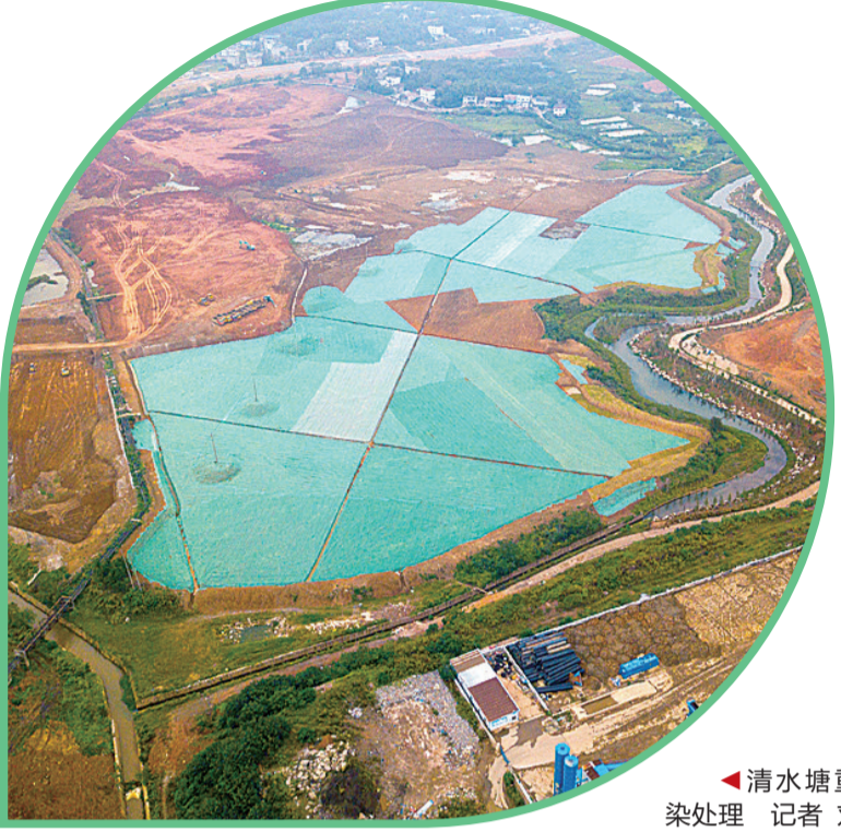
清水塘重金属污染处理

1988年,我进入石峰区环保局工作,当时住在单位宿舍里。当时,清水塘还是株洲污染的重灾区,作为环保工作人员的同时,我也是环境的受害者。 白天,我要外出处理市民投诉的环境问题,当时株洲治理环境的力度远远比不上现在,环境治理成效不痛不痒。下了班在宿舍,常常可看到天空飘过一片片黑烟,为了防止烟尘进屋,南边的窗户我从来没有开过。每到冬天,整个北区的天空都是雾蒙蒙一片。 后来,我参与了全市针对污染企业的消烟除尘行动,株洲空气开始有了改善。大约在2003年,株洲引进了新奥燃气,我每天忙于企业煤改气的策划和推动,两年之后,株洲90%的锅炉经过了煤改气成功,逐步脱离了“煤味”的株洲,空气质量迎来了质的改变。 同样,株洲水质也发生了巨大变化。我记得霞湾港水质最差时是IV类甚至V类水质,如今水质已稳定在了II类。 我朋友常常问我,“湘江水怎么样,能不能喝?”我都告诉他们,放心喝,我家里也是喝的湘江水。