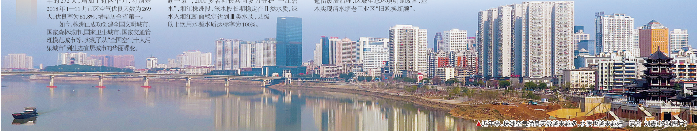
△近年来,株洲空气优良天数越来越多,水质也越来越好