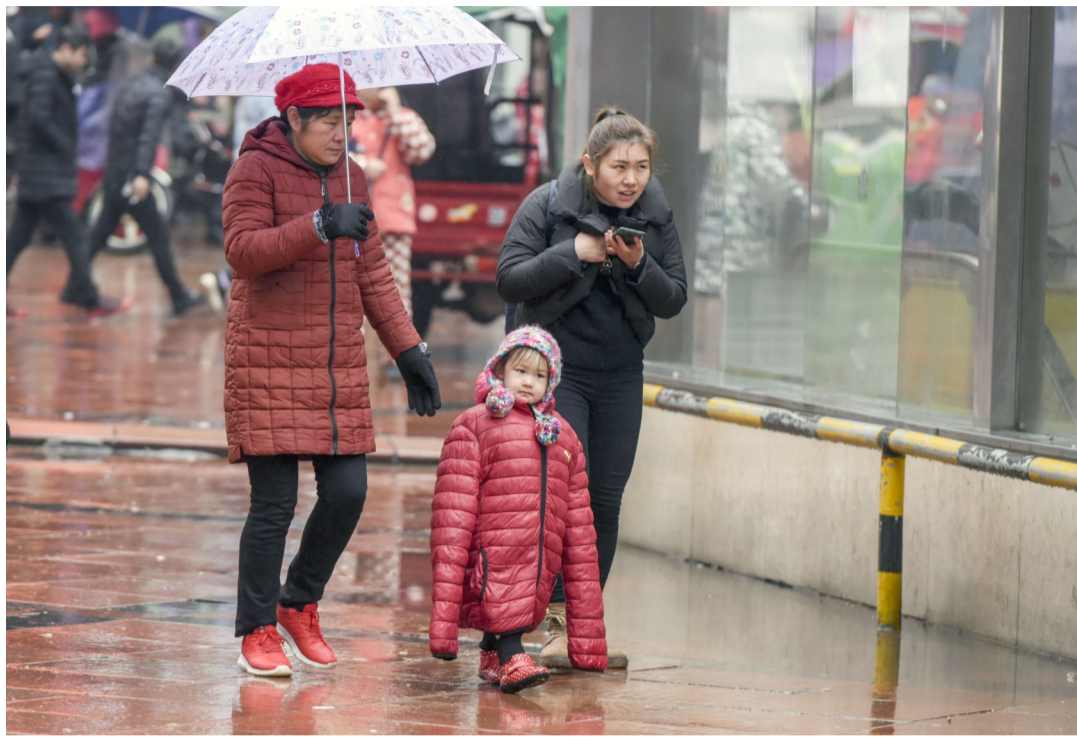
▲昨天,芦淞市场步行街,一个孩子穿着大几号的羽绒服御寒