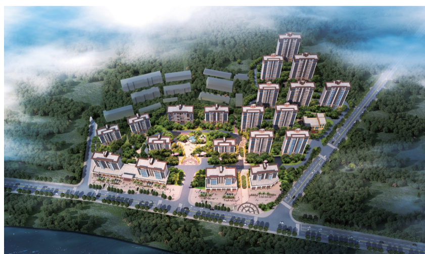
▲碧桂园·江山一品鸟瞰图