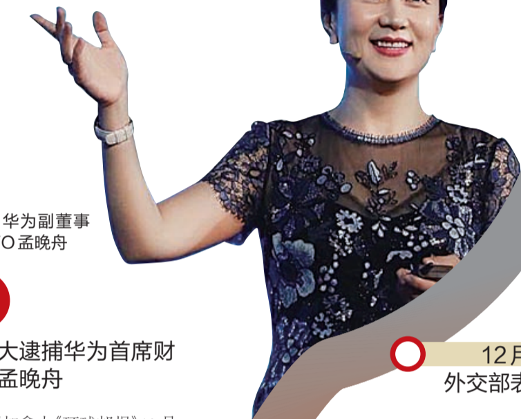
▲华为副董事长、CFO孟晚舟

连日来,华为公司首席财务官孟晚舟被加拿大当局拘押一事引发舆论高度关注,受到中方严正交涉、强烈抗议。昨天,晚报编辑以时间顺序,梳理了整个事件的来龙去脉。