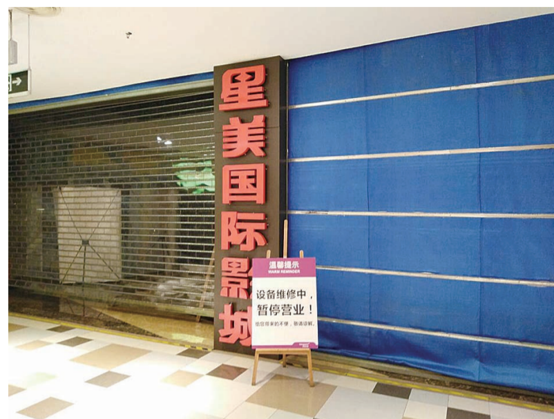
▲星美华润万家店已暂停营业多月