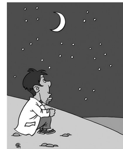
(答案可在本期内找)