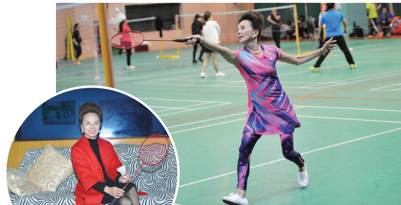
▲60岁孙姐打起球来脚步轻盈