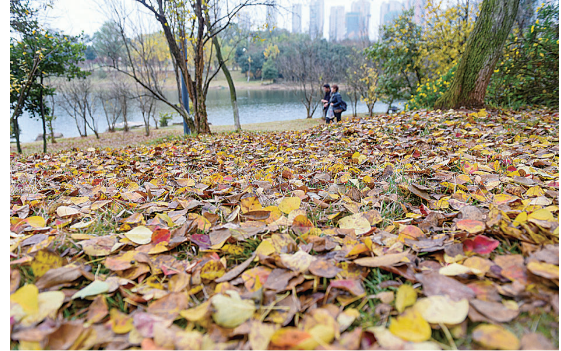
▲风萧萧,落叶一惊随风摆。昨日,神农湖旁落叶遍地