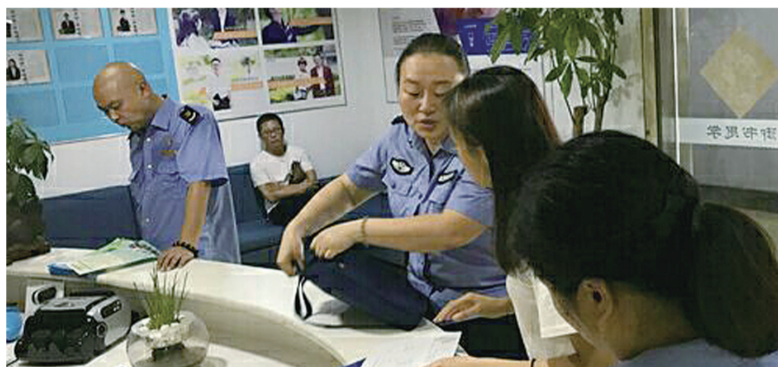
▲芦淞区教育局联合该区公安、工商等部门排查校外培训机构

2018年伊始,我市对违规校外培训机构进行了专项整治。校外培训机构,主要存在哪些违规现象呢?