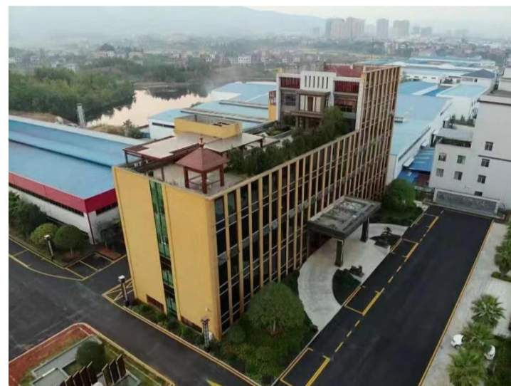
▲茶陵经开区抓主导产业推动园区升级

今年以来,茶陵经开区围绕“产业项目建设年”工作要求,全力推进产业项目建设,优化园区发展环境,加快培育园区主导产业,实现园区发展转型升级。