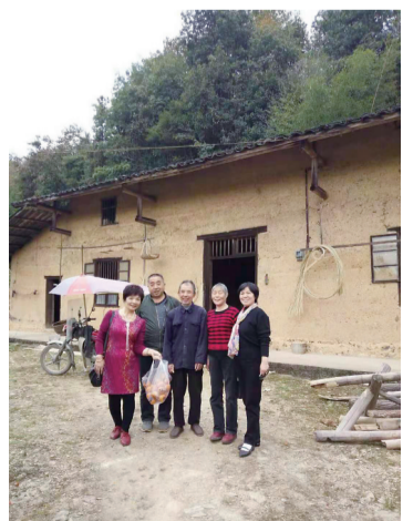
▲株洲知青当年住过的房子

很快,车队在浏阳县城分散,2000多位株洲学生奔赴各个乡镇。曙光中学的44位同学,全部被分派到浏阳永和镇。