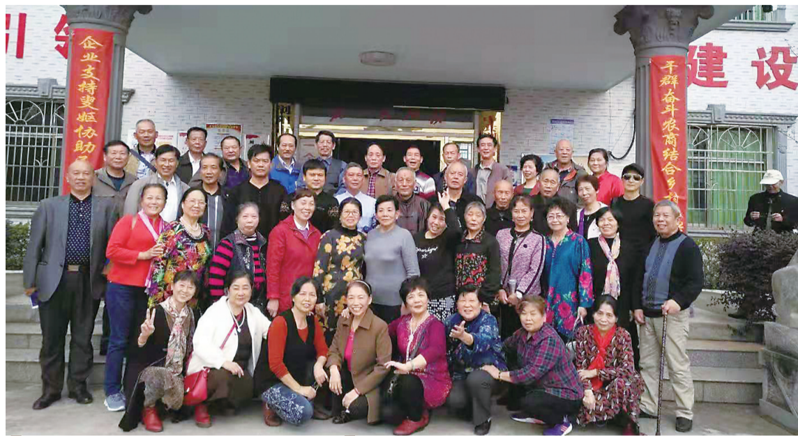
▲株洲知青重返浏阳