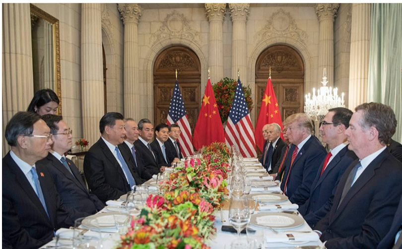
▲当地时间12月1日,习近平应邀同特朗普在布宜诺斯艾利斯共进晚餐,举行会晤

发展方向。双方将适时再次进行互访。双方同意加强各领域对话与合作,增进教育、人文交流。特朗普表示,美方欢迎中国学生来美国留学。双方同意采取积极行动加强执法、禁毒等合作,包括对芬太尼类物质的管控。中方迄今采取的措施得到包括美国在内的国际社会的充分肯定。中方决定对芬太尼类物质进行整类