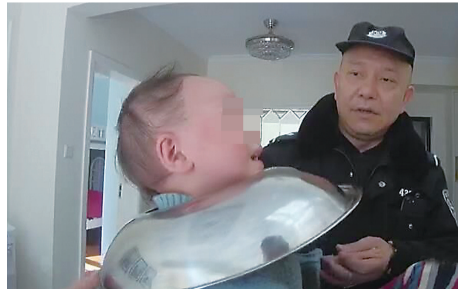
锅盖套进脖子取不出,孩子不停哭闹

本报讯(记者 肖蓉 通讯员 邓伊善)11月28日,石峰公安分局接到都市兰亭小区谭女士报警称,两岁的孙子将一个锅盖套进了脖子,怎么也取不出来了。