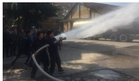
▲“模拟灭火”演练现场

11月28日凌晨,河北省张家口市桥东区大仓盖镇盛华化工有限公司附近发生一起爆炸事故,原因是一危化品运输车辆等待进厂时爆炸引燃周围车辆。目前,已导致23死22伤。