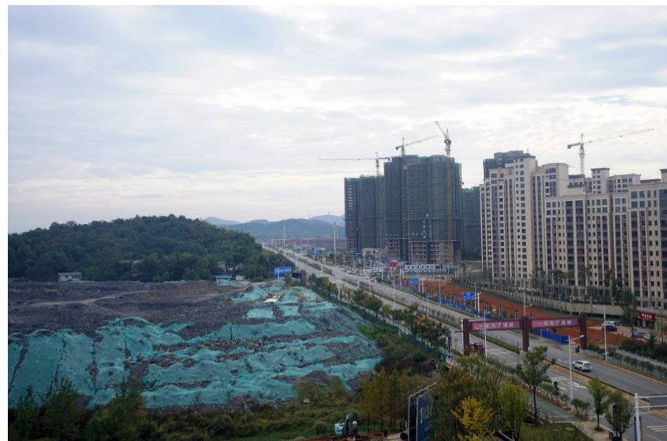
▲金龙东路产业项目带

前日,潍柴动力汉德车桥(株洲)传动件智能制造基地工地里的厂房正抓紧施工,一批批设备源源不断向此汇聚。该项目既是省“五个100”重点产业项目之一,也是荷塘区有史以来引进的最大产业项目,一期工程有望年内投产。