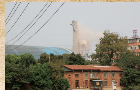
▲电厂烟囱拆除瞬间