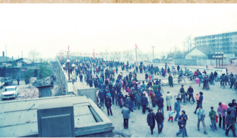
▲株洲大桥正式开通前一天,万人空巷看大桥