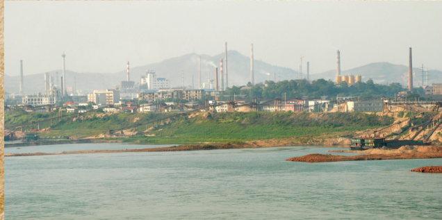
▲曾经烟囱林立的石峰区,现在企业大量搬迁,生态宜居新石峰呼之欲出