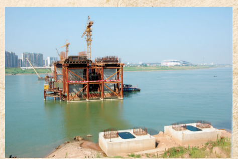
▲2008年5月,芦淞大桥正式开工建设,让庐山路与红港路两大动脉完美对接,一气呵成,气贯西东。