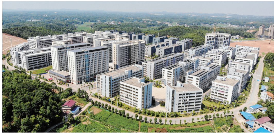
▲新芦淞玉城服饰白关产业园

董家墩高科园的根底在哪? 航空、服饰。 今年以来,园区以“产业项目建设年”为突破口,聚焦两大核心产业强链、补链、延链,推动园区高质量发展,取得亮眼成绩。 1月至10月,园区规模以上工业增加值24.02亿元,增长11.9%;高新技术产品产值47.83亿元,增长13.91%;签约引进项目19个,总投资额531.5亿元,其中7个项目已顺利开工投产。