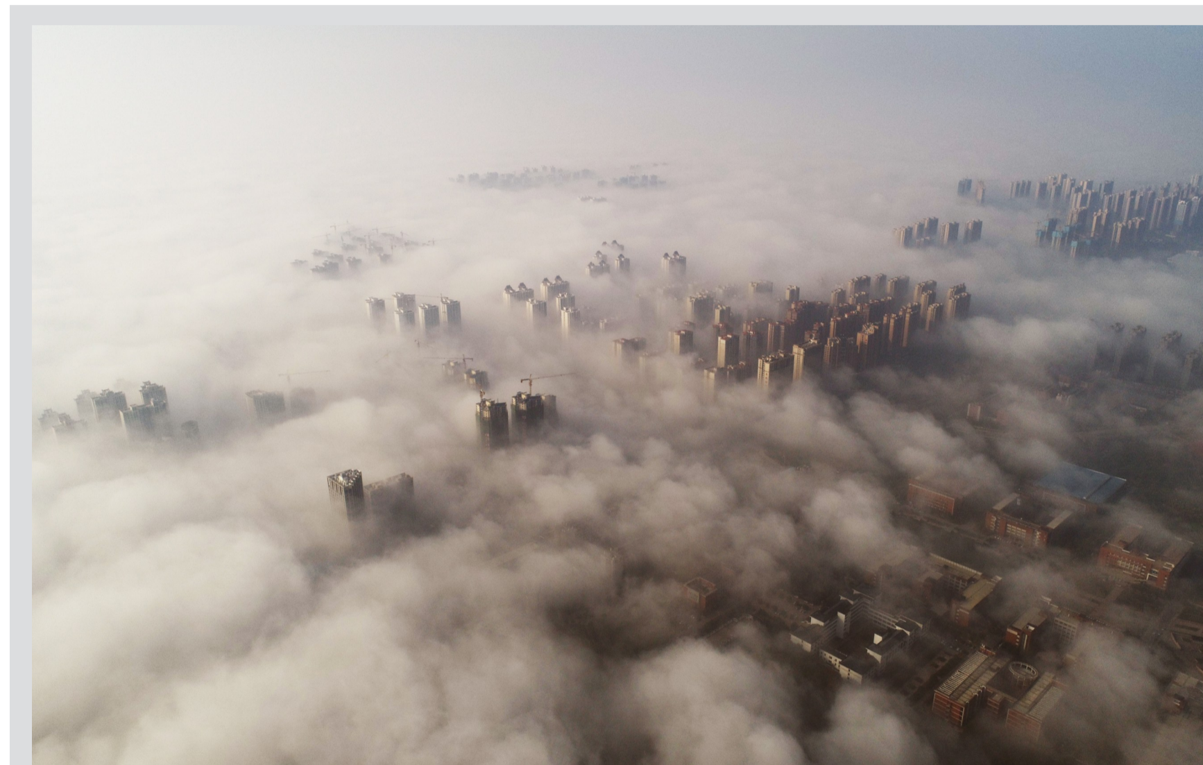
▲昨晨,在湖南工业大学上空航拍到的城市雾景