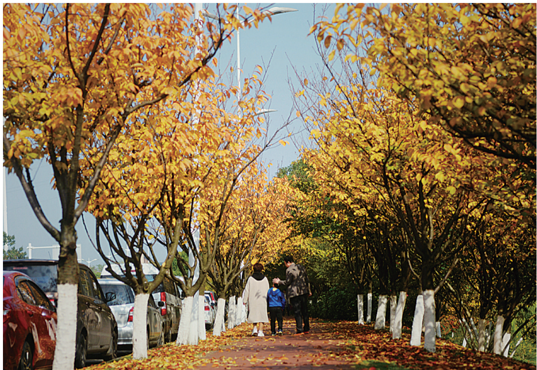
▲昨日下午,市民漫步在湘江风光带的阳光中