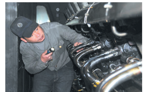
▲汽修师傅在检修车辆

本报讯(记者 肖捷 通讯员 陈诚)近日,在省交通运输厅技术人员支持下,醴陵市交通运输局道路运输管理所在该市范围内推行汽车维修电子健康档案。