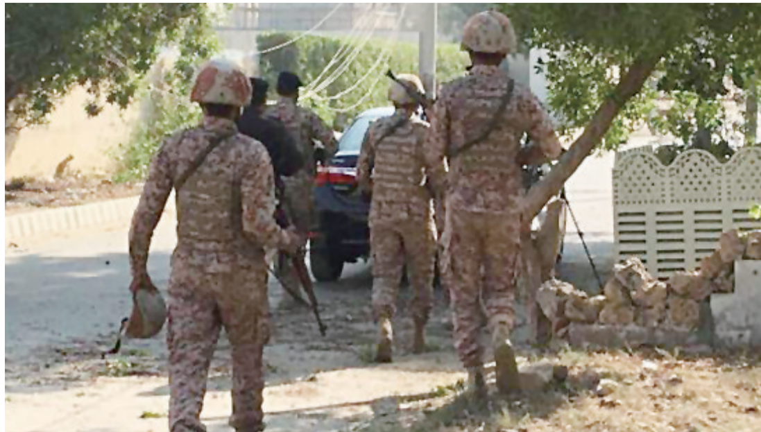
▲11月23日,安全人员到达袭击现场

中国驻巴基斯坦大使馆23日发表声明,对当天发生的针对驻卡拉奇总领馆的恐怖袭击事件表示强烈谴责。声明说,目前局势已得到控制,3名恐怖分子已被击毙,中方人员在此次袭击中没有伤亡。