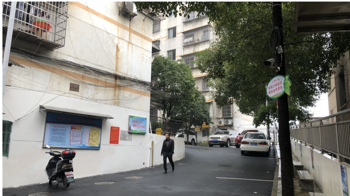
▲新园楼小区内加装监控摄像后,车辆刮蹭、盗窃等事件都没了

昨日上午10点,记者到访时,新园楼小区阳光和煦,一片安详。小区不大,但胜在干净整洁。“一开始,这个小区能不能实现自我管理,我们心里都没底。”荷塘区域管局物管办负责人说,这个脱离物管10余年的小区,现在已成了业主自治的样板小区之一,让别的无物业管理老旧小区来参观学习业委会成员们很自豪。