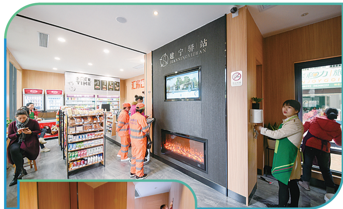
▲“建宁驿站”内部的休息区和便民商店

为了方便母婴及行动不便人士,“建宁驿站”在建筑右侧独立隔离出来一间小房间,并修筑了残疾人通行便道,里面有婴儿护理台、幼儿座便器、卫生袋、恒温水龙头、感应式洗手液等设施。