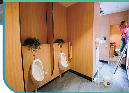
▲内部洗手间