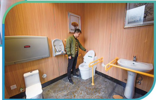
▶第三卫生间,设有残疾人专用马桶、母婴专用设施