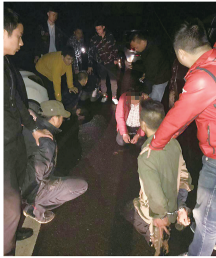
民警成功将犯罪嫌疑人一举抓获

本报讯(记者 肖蓉 通讯员 李思远)老乡在一起本应互帮互助,他们却结伙干起了偷盗工地扣件的行当;做生意要诚实守信,他们明知是赃物却违法收购。近日,经开公安分局刑侦大队成功打掉一盗窃团伙,抓获犯罪嫌疑人6人,破获涉及长沙、株洲、湘潭等地系列盗窃工地钢管扣件案50余起,涉案金额50余万元。