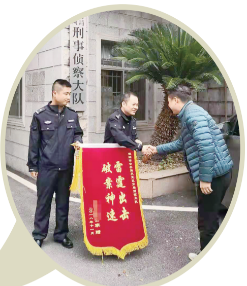
▲玲玲家属向天元警方送锦旗表示感谢

另一边,晚上10点左右,曹宇带队在距离麻将馆不到400米一银行ATM机旁,将刚取完钱的男子抓获。至此,警方在案发后5小时内,迅速侦破此案,人质未受伤害。