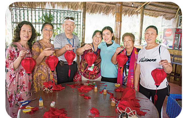
大家体验制作手工灯笼