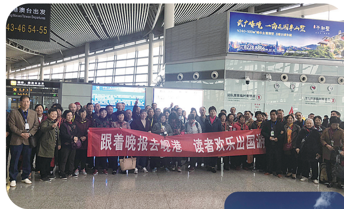
所有读者出游前大合影