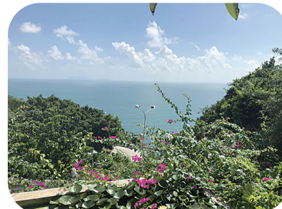
在山茶半岛可以俯瞰美丽的海港