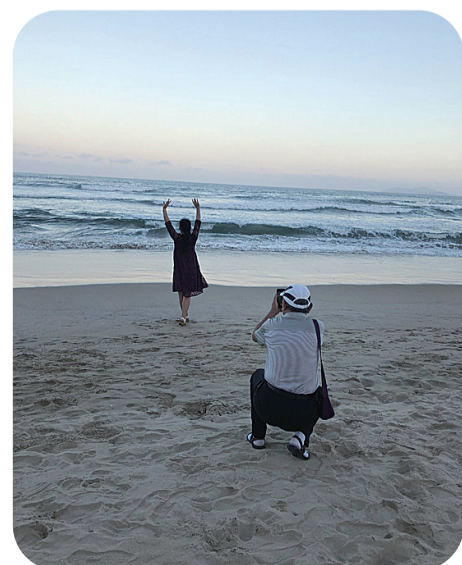
给妻子在海边拍照

很多参团的读者中,男士全程为妻子服务,提包、拍照、付款购物,真正体现了中国好男人的一面,让随行的记者都看了眼红。如果老了,老两口身体硬朗,手头也有一些积蓄,两人一起出国看看这个世界的不同面貌,真可谓人生已无憾了。