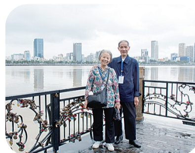
张奶奶和老伴在爱情桥合影