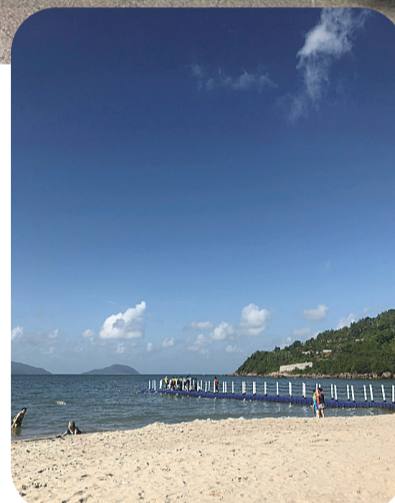
岷港细软的沙滩踩上去真舒服