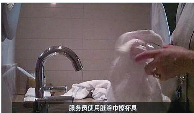
▲网友发布的视频(截图)