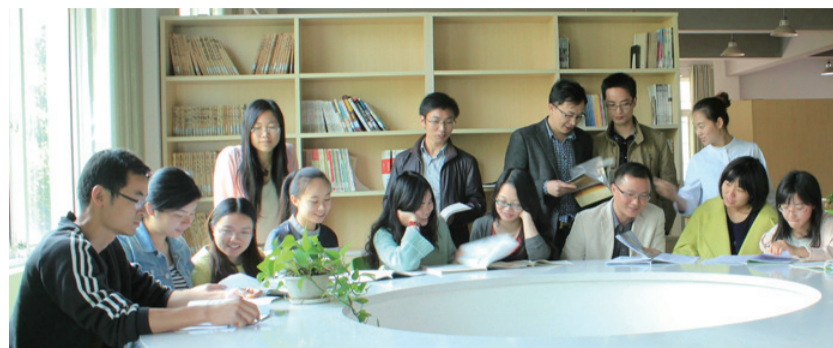
▲学校经常组织青年教师读书分享会

一所承载着60余载风雨春秋的老校、一所散发着青春活力的现代校园,市四中一直坚持以“文明创建”为目标引领学校发展,把文明创建工作贯穿于学校工作的各方面。