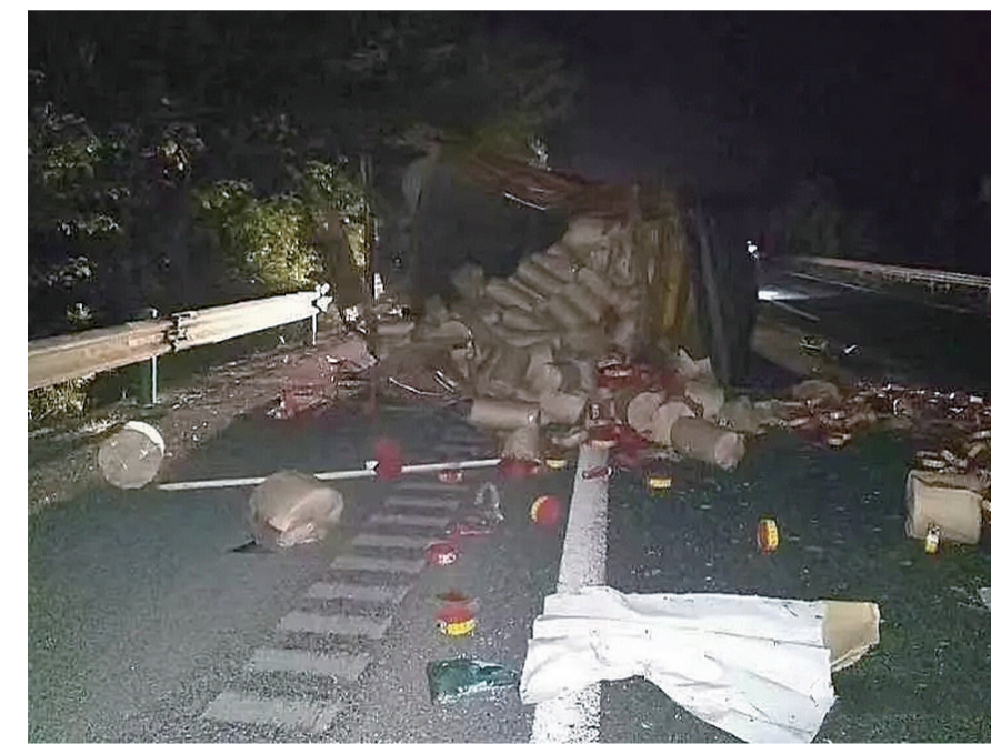
▲货车侧翻后部分鞭炮散落路面

本报讯(记者 刘玺 通讯员 潘伯金)驾车在高速公路出了交通事故,司机应及时报警,何况车上装的还是危险品——鞭炮,可这名司机却弃车溜了。