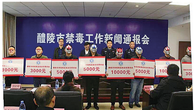
▲举报涉毒违法行为的市民受到奖励

本报讯(记者 肖蓉 通讯员 瞿思文)昨日,醴陵召开2018年禁毒工作新闻通报会,对8名积极举报涉毒行为的热心群众公开颁奖7.1万元,其中获奖最高的达3万元,同时受到表彰的还有16个缉毒先进单位。 今年以来,醴陵市公安局机关破获毒品刑事案件137起,逮捕直诉125人,治安拘留437人,强制戒毒143人。特别是在今年9月期间,“4·7”特大贩毒案成功告破,共刑事打击犯罪嫌疑人32名,收缴毒品6.2公斤,扣押涉案车辆6辆,成功斩断一条横跨湖南、江西、云南、广东四省的贩毒通道。 在昨日通报会上,共计兑现奖金26万余元。