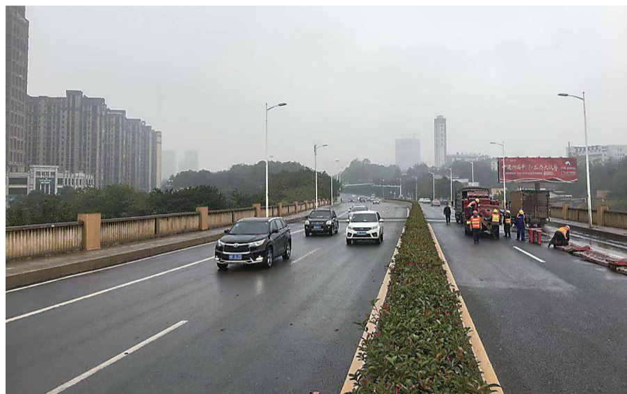
▲昨天下午6点,石峰大桥维修施工进入尾声

本报讯(记者 伍靖雯 通讯员 何云)今天起,开车上班要经过石峰大桥的,不用再早起了。经过2个月加班加点施工,石峰大桥今日凌晨恢复双向正常通行。昨日,市城管局市政工程维护处相关负责人介绍,此次2个月的分封施工,是为了进行石峰大桥伸缩缝更换工程。该工程于9月13日正式开工,原项目批复工期为4个月,考虑到石峰大桥为我市环线重要组成部分,是石峰区、天元区的重要交通通道,经与市交警支队、大桥原设计单位以及施工单位多次协商与优化,确定了交通及施工组织方案,最终压缩施工工期到2个月。