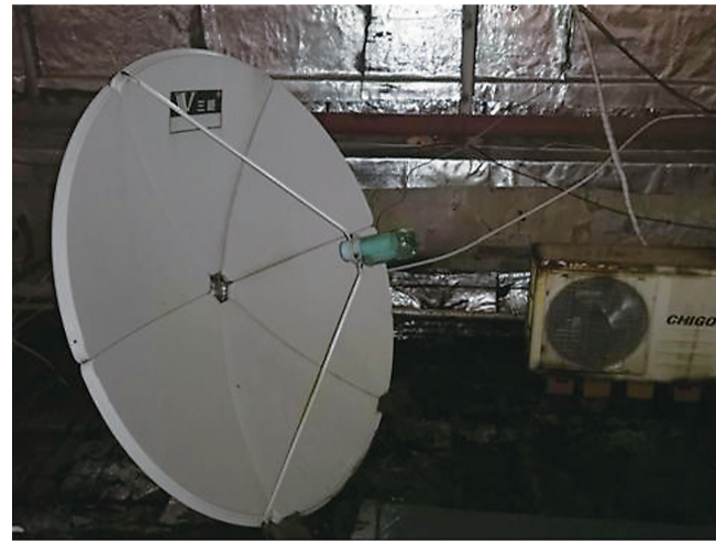
▲我市一家酒店非法安装卫星电视接收器,接收境外卫星电视

本报讯(记者 肖蓉 通讯员 杨小红)11月6日,市市场综合执法局在专项行动中,发现我市一家酒店非法安装卫星电视地面接收设施,现场查缴卫星电视地面信号接收机9台。