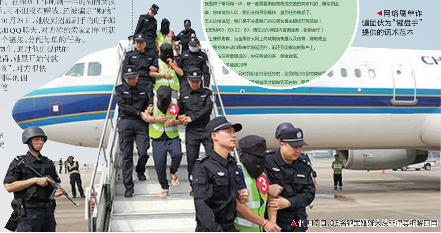
▲11月7日,36名犯罪嫌疑人从菲律宾押解回国