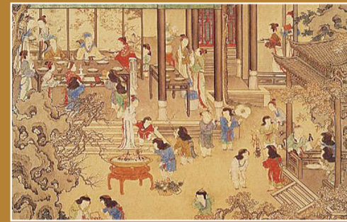
▲苏汉臣《秋庭戏婴图》(局部)