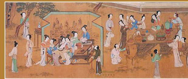
▲明代《上元灯彩图》(局部)