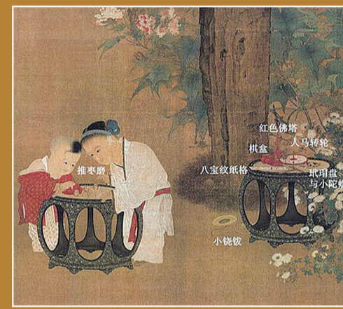
▲清 姚文瀚《岁朝欢庆图》