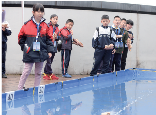
▲选手在航海模型竞速和红船模型制作项目上,各展风采

本报讯(记者 肖蓉 通讯员 周谭清)一架架“飞机”盘旋、空战,竞速蓝天;一艘艘“航船”组成队伍,把“足球”射入对方球门……11月10日,首届“健康湖南”全民运动会“教授杯”航空航海模型总决赛在株洲云龙示范区职教城斯凯航模基地开幕。来自全省的29支代表队、450多名运动员参赛。