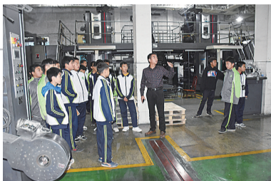
▲小记者走进株洲日报社,探秘报纸出版流程,与记者们一起过节