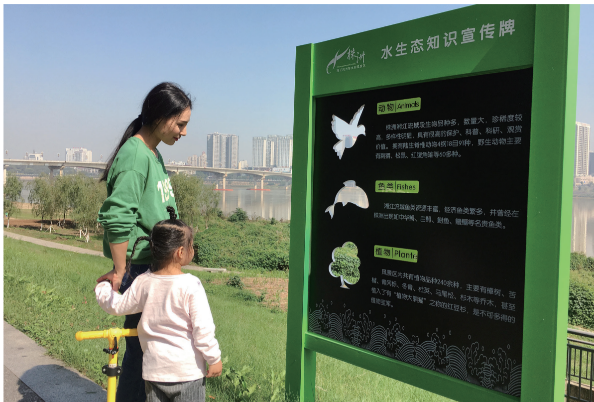
▲湘江风光带上设立了水生态知识宣传牌,让游客了解湘江生态状况