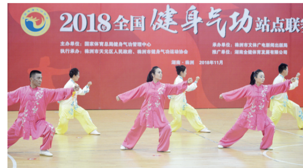
▲全国健身气功站点联赛总决赛在株洲举行

本报讯(记者 肖蓉 通讯员 周谭清)昨日,又一全国性赛事——全国健身气功站点联赛总决赛在我市举行。通过半年的层层选拔,最终,来自全国的181名参赛人员参加总决赛。