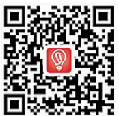
▲扫码下载“智慧株洲”APP

本报讯(记者 肖蓉 通讯员 李波)喜爱电影的市民有福了!记者从市电影管理服务中心获悉,在株洲市第五届公益电影展映月期间,我市各大影院积极参与,提供了场地和免费观影券,将播放同期影片,邀市民走进影院,免费观看。