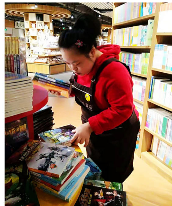
▲心智障碍者在整理书籍,尝试进行简单的工作

本报讯(记者 戴凛)最近几天,方唯书店来了几位特殊的“图书管理员”,说他们特殊,因为他们都是盛康日托中心的大龄心智障碍青年。该活动的组织者表示,希望通过职业体验,让他们有机会更多地接触社会。