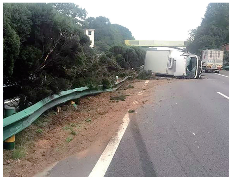
▲事故现场,货车侧翻在地

本报讯(记者 刘玺 通讯员 孙哲)前日,京港澳高速株洲段往北方向,一辆货车撞上前车掉落的传动轴后,车子失控侧翻,幸好没有造成人员伤亡。