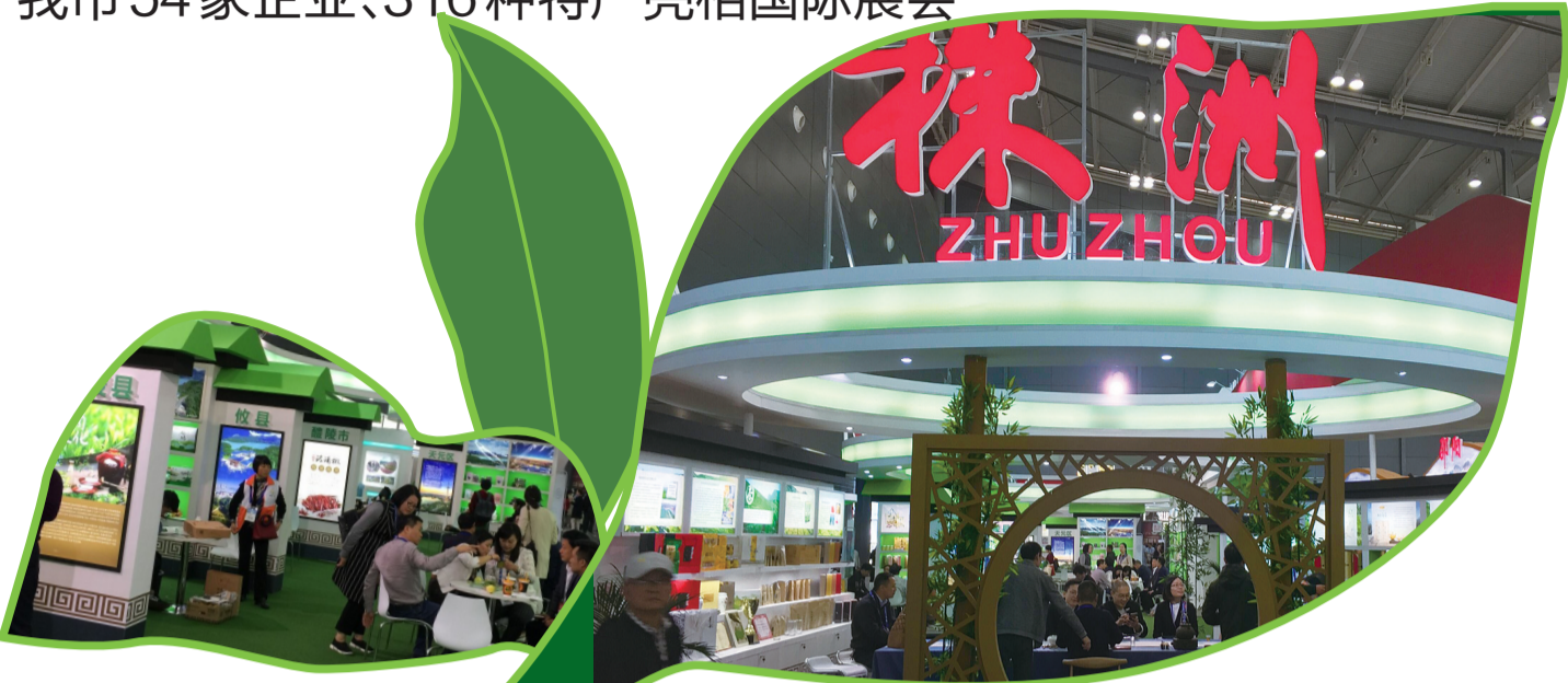
▲株洲展馆人流涌动

巡馆过程中,毛腾飞、阳卫国对株洲馆的组织工作给予肯定。他们强调,要深入贯彻落实习近平总书记关于“三农”工作的重要指示精神,大力实施乡村振兴战略,着力推进农业现代化。要坚持质量兴农、品牌强农,注重绿色发展,不断打造更多具有市场竞争力的特色农产品。要借助农交会、农博会大平台,全面展示株洲现代农业新技术、新产品、新成果,让株洲更多优质农产品走向全国、走向世界。