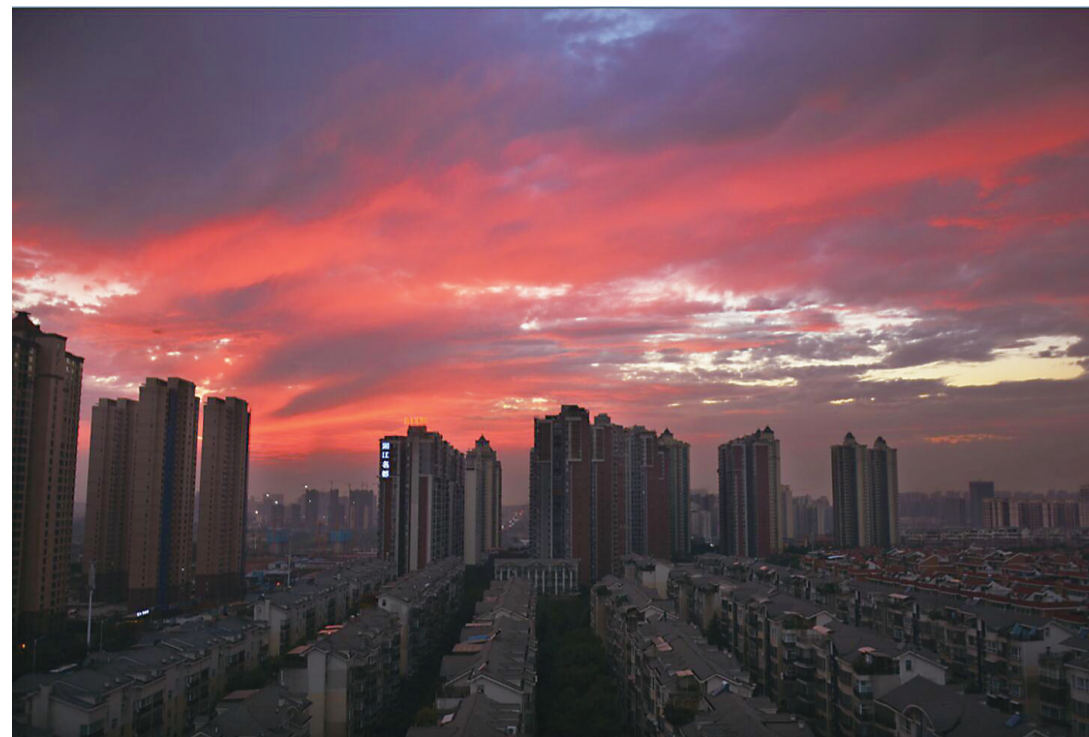
▲昨天傍晚,天元区珠江丽苑小区上空晚霞漫天