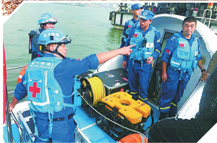
▲重庆万州坠江公交车于10月31日23时30分左右被打捞出水